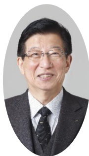
静岡県知事 川勝 平太