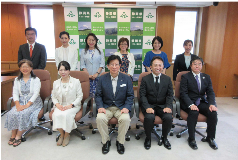
【令和5年度受賞者の皆様】