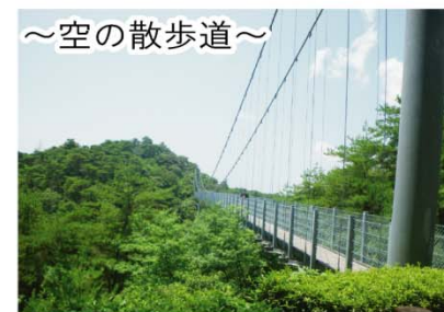
～空の散歩道～ 長さ150mの吊り橋で、アカマツの樹海や天竜川、浜北の町並みが望めます。