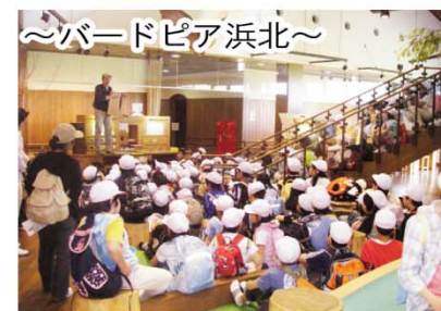
～バードピア浜北～ 鳥類を中心とした自然に関する情報を発信。色々な事が学べます。