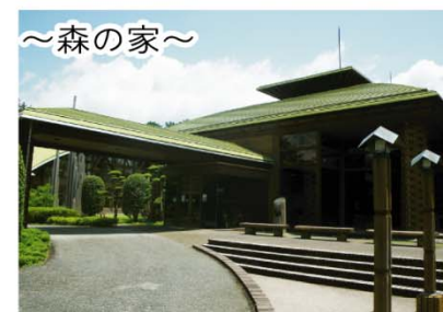
～森の家～ 宿泊・研修やレストランなど様々な用途に利用できる施設です。

◎静岡県西部農林事務所 森林整備課 浜松市中区中央一丁目12-1 TEL. 053-458-7236