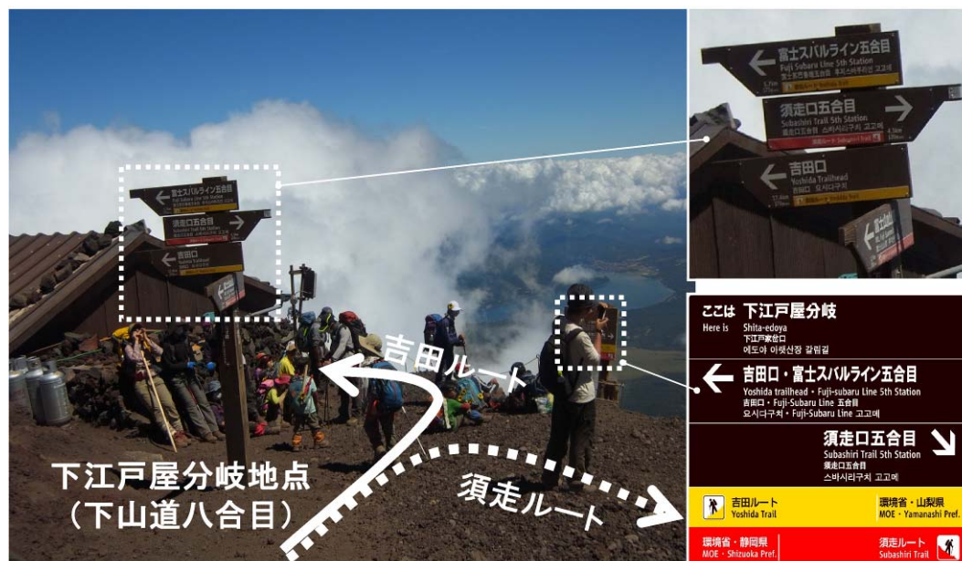
図 吉田ルートと須走ルートの下山道分岐地点