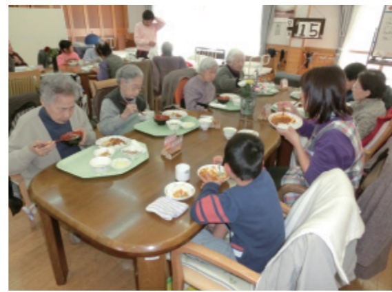
月に1回、高齢者と子どもたちが一緒に一つのテーブルを囲んで交流する「食事交流」が行われています。

同じ敷地内にデイサービス、保育園、放課後児童クラブ、障害者グループホームの4つの施設が隣接。この4つの施設は、日常生活の中で自然と交流をしています。特に盛んなのは、デイサービスを利用する高齢者と保育園の園児たち。デイサービスの利用者にとって、子どもの声はまるでいつも流れているBGMのようなもの。デイフロアーには1、2歳の子どもたちが先生に手を引かれて遊びに来たり、デイサービスと園の廊下の陽だまりで先生が読む絵本に聞き入る子どもたちの姿を見つけたり。子どもたちとのふれあいに励まされ、元気をもらい、明るく穏やかな表情で自宅へ戻る高齢者の姿が印象的です。また放課後児童クラブの子ども達も夏休みなどには積極的にデイサービスに足を運び、高齢者と過ごす時間を楽しんでいます。