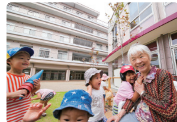
介護老人福祉施設、サ高住、そして保育園が園庭をはさんでコの字型に建っています。お年寄り子ども達とが自然に交流をしています。

地域の願いに応えたいとの想いからはじまった、保育園と老人短期入所施設・デイサービスセンターなどが一緒になった県内初の在宅複合施設「長上苑」を運営する(福)七恵会が、平成26年春に浜松市中区に開設した「浜松中央長上苑」。介護老人福祉施設、保育園、そしてサービス付き高齢者向け住宅を核に、地域の人たちも利用できる喫茶室や屋外花壇が設けられ世代を超えた交流ができる、「ひとつの町」のような空間です。保育園児たちが園庭で元気に遊ぶ姿を高齢者施設のベランダから見守ることが可能だけでなく、園行事に参加するなど日常的な交流も行われています。また、地元自治会と協力し介護講座を実施したり、館内にある「喫茶うるおい」をボランティアの皆さんが運営するなど、地域とともに歩んでいます。