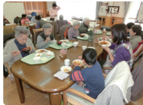
月に1回、高齢者と子どもたちが一緒に一つのテーブルを囲んで交流する「食事交流」が行われています。

同じ敷地内にデイサービス、保育園、放課後児童クラブ、障害者グループホームの4つの施設が隣接。この4つの施設は、日常生活の中で自然と交流をしています。特に盛んなのは、デイサービスを利用する高齢者と保育園の園児たち。デイサービスの利用者にとって、子どもの声はまるでいつも流れているBGMのようなもの。デイフロアーには1、2歳の子どもたちが先生に手を引かれて遊びに来たり、デイサービスと園の廊下の陽だまりで先生が読む絵本に聞き入る子どもたちの姿を見つけたり。子どもたちとのふれあいに励まされ、元気をもらい、明るく穏やかな表情で自宅へ戻る高齢者の姿が印象的です。また放課後児童クラブの子ども達も夏休みなどには積極的にデイサービスに足を運び、高齢者と過ごす時間を楽しんでいます。