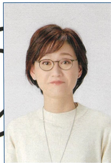
相談員 社会保険労務士