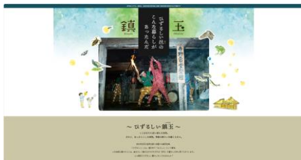
ひずるしい鎮玉 ホームページ