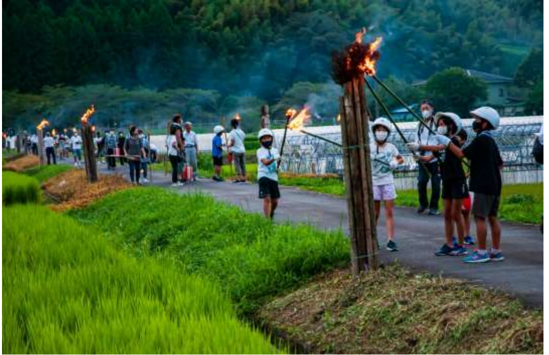
一般部門 「虫送りの火 (何の虫おーくーる・・・)」