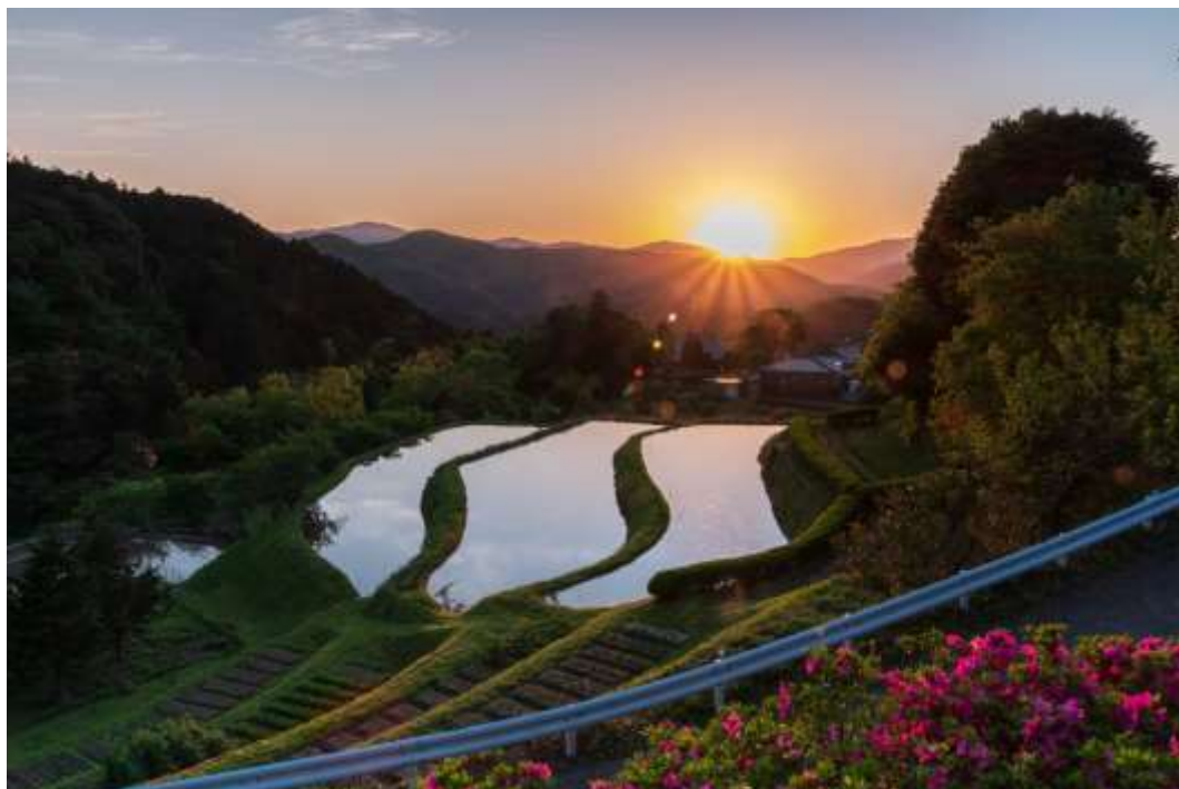
一般部門 「ハートウォームサンセット」 撮影地：伊豆市湯ヶ島