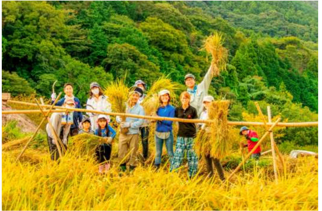
邑づくり特別賞 「秋の収穫」