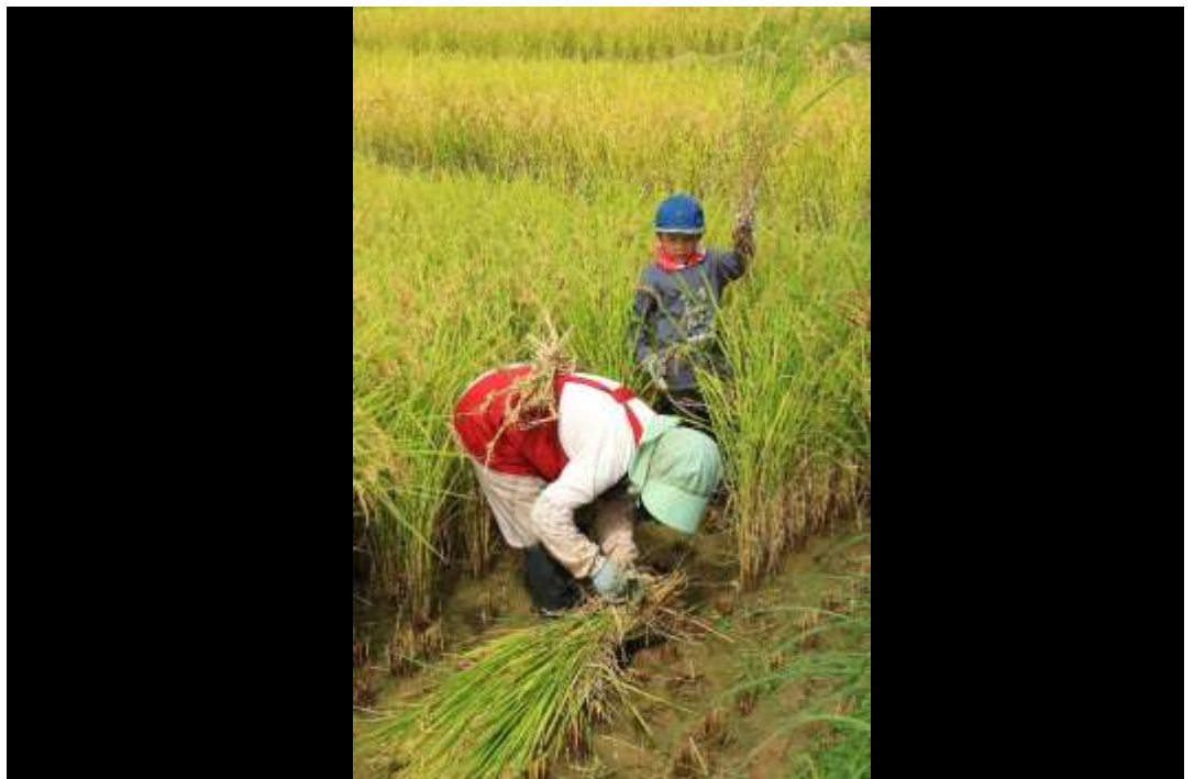
邑づくり特別賞 「孫とおばあちゃん」