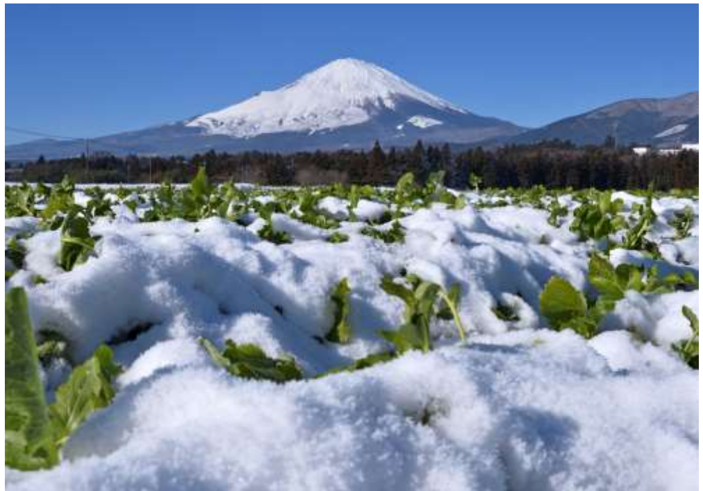
一般部門 「雪纏う水かけ菜」