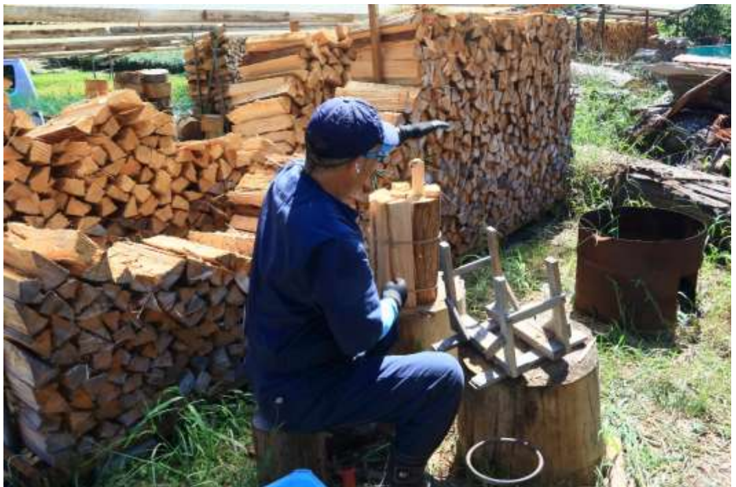
「薪作り」 撮影地：静岡市清水区布沢 (布沢)