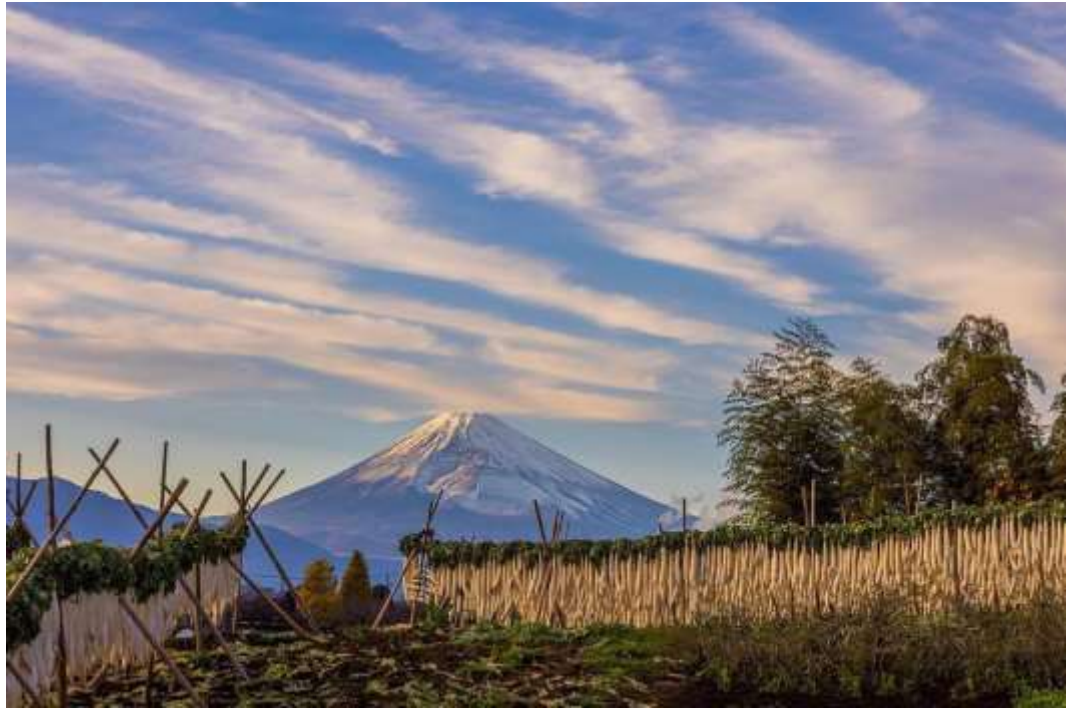
SNS 部門 「冬の風物詩」