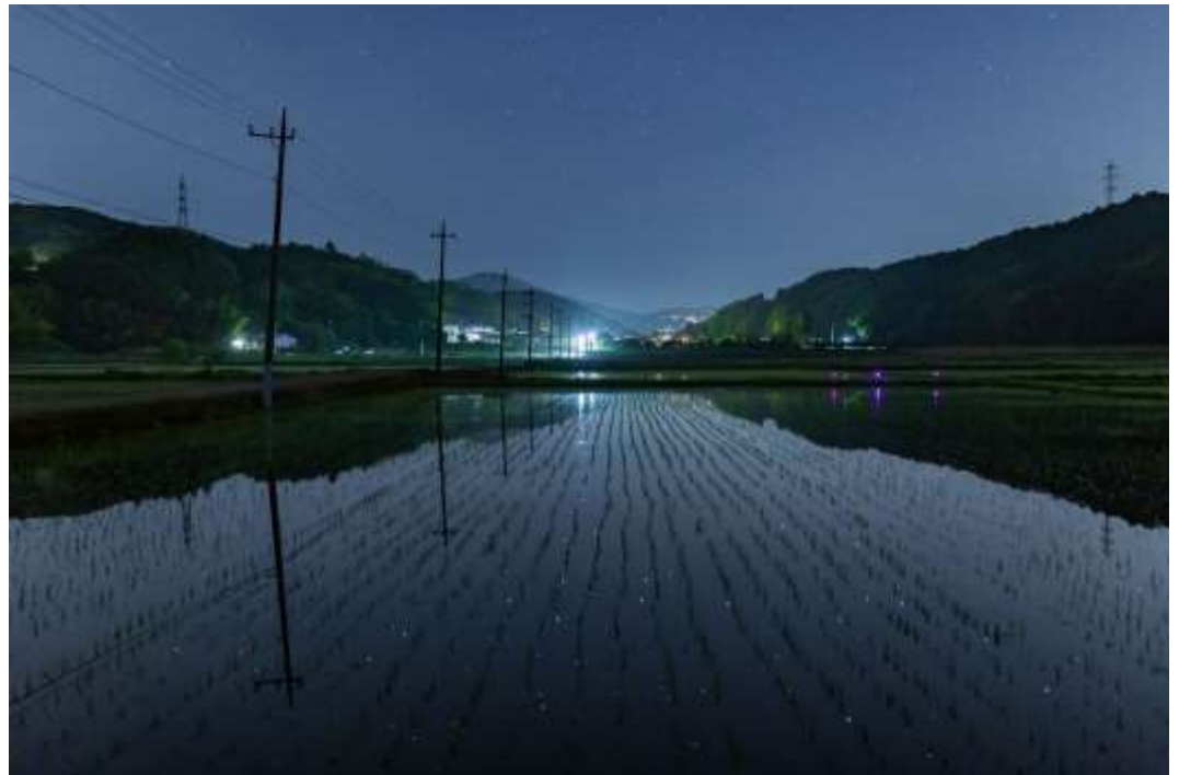
「水田に映る星々」 撮影地：函南町田代