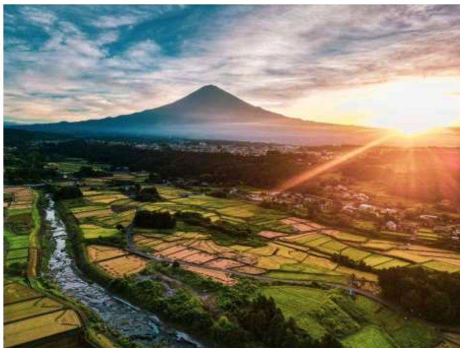
「日が昇る空と 富士山と田んぼ」 撮影地：富士宮市