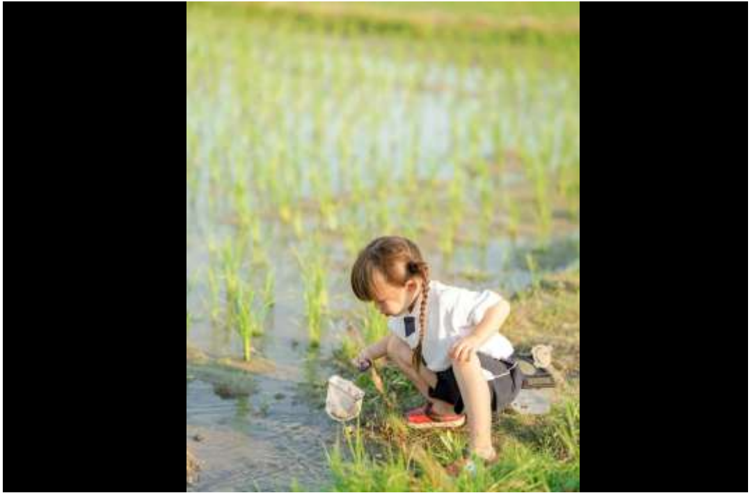
SNS 部門 「自宅裏の田んぼ」