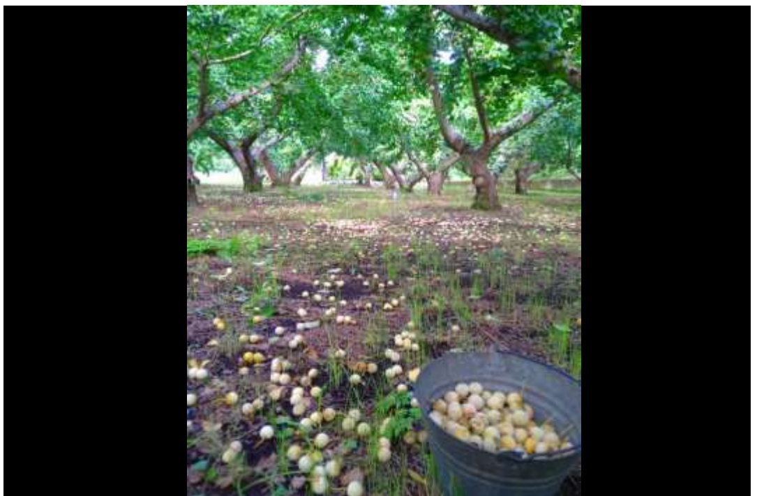
SNS 部門 「今年も収穫が 始まりました」