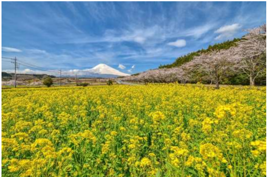
SNS 部門 「一面の菜の花畑 と富士山」