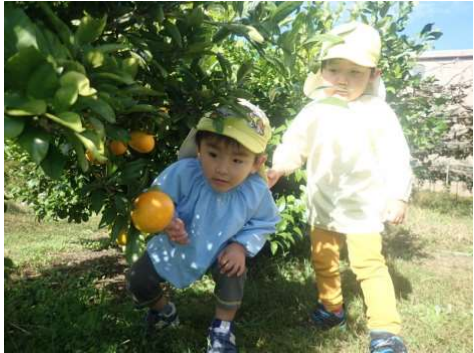
「みかん大好き！」 撮影者：神山 雅敬 撮影地：富士宮市小泉