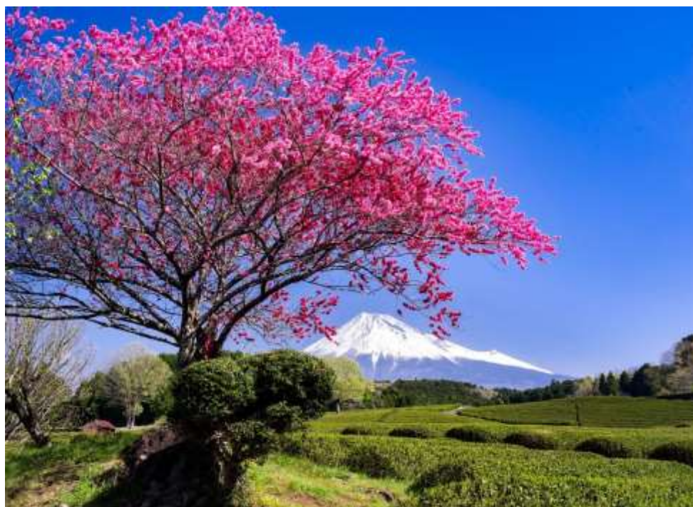
「ヤマモモの咲く茶畑」