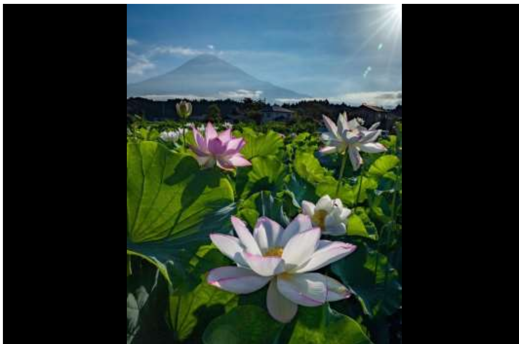
SNS 部門 「蓮田の朝」