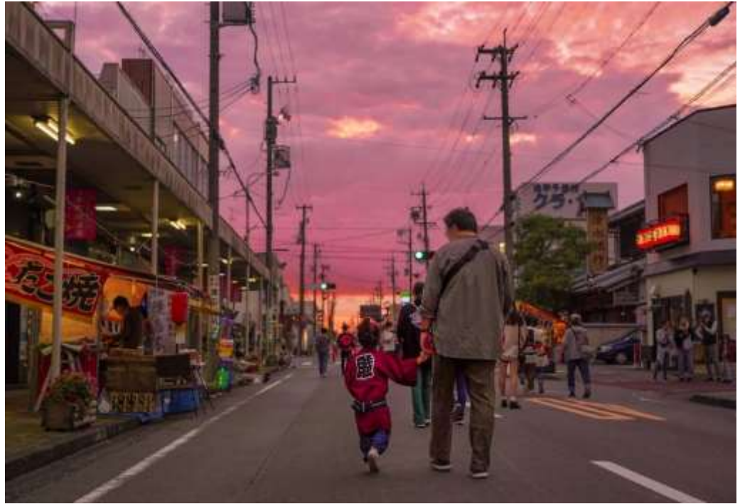
「夕焼けの 歩行者天国」