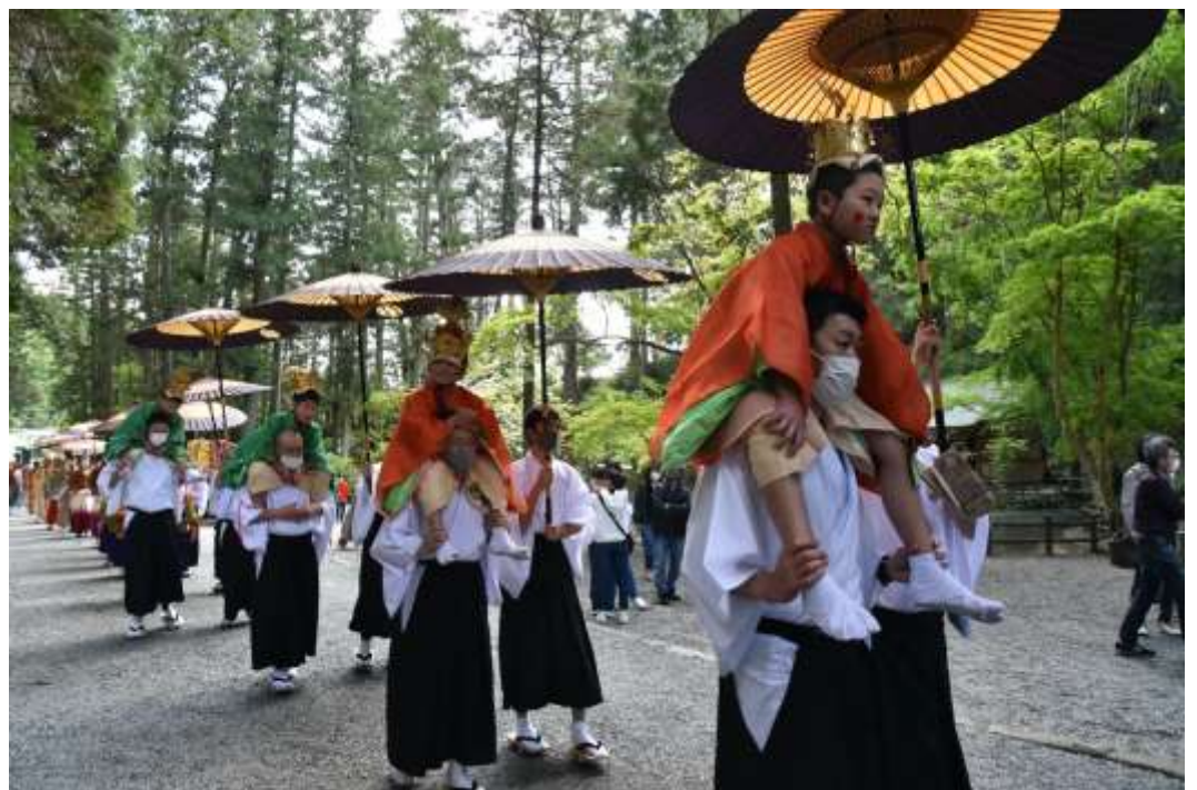
「行列」 撮影地：森町 小国神社 (一の宮の里)