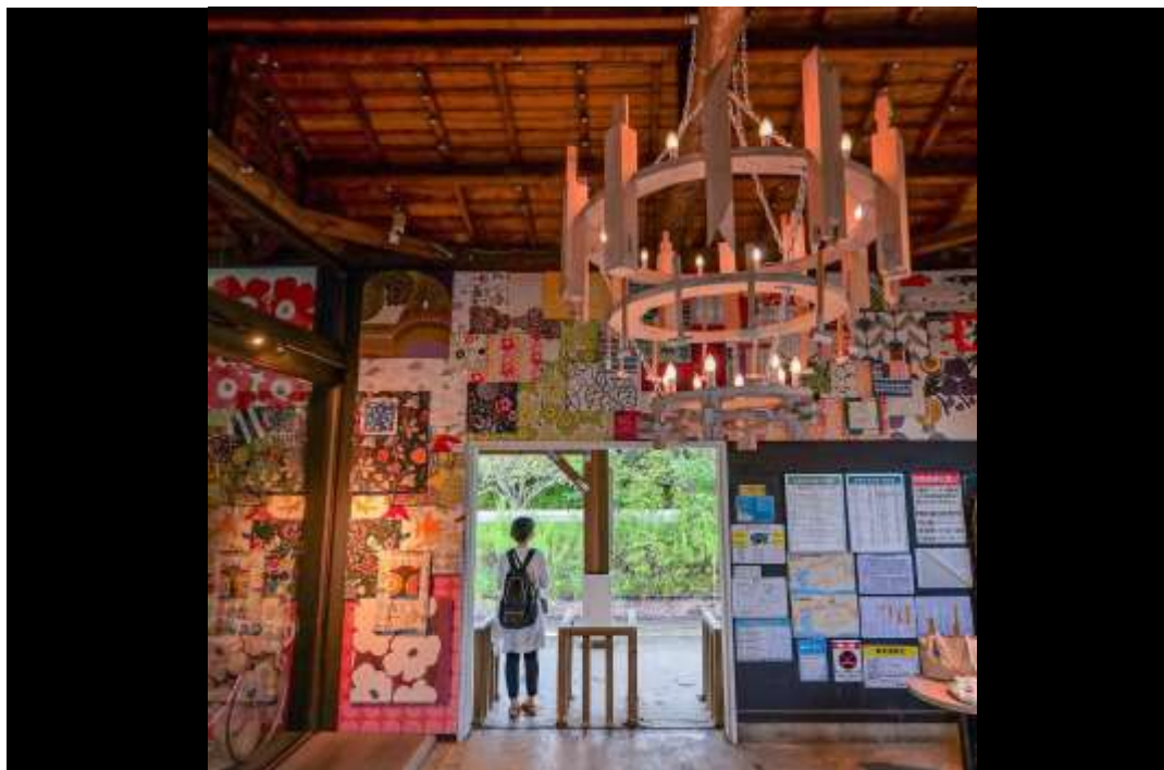
「夏休みの過ごし方」 撮影地：浜松市北区 都田駅 (都田地区)