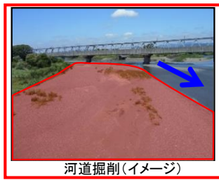
河道掘削(イメージ)