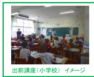
出前講座(小学校)イメージ