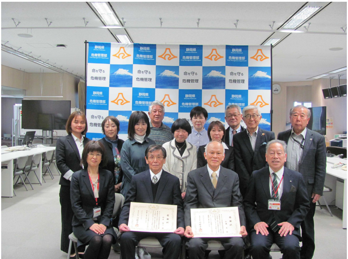
令和4年度感謝状贈呈式