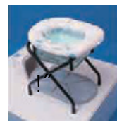
かんいといれ 簡易トイレ でんき つか (電気を 使いません)