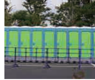
かせつといれ 仮設トイレ ぼくす がた (ボックス型)