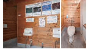
じこしよりがた といれ 自己処理型トイレ