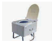
かんいといれ 簡易トイレ でんき つか (電気を 使います)