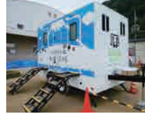
といれとれーらー トイレトレーラー