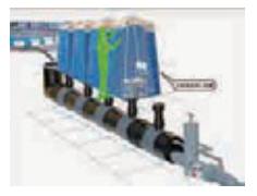
まんぼーるといれ マンホールトイレ