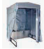
かせつといれ 仮設トイレ くみた がた (組立て型)