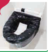
けいたい といれ 携帯トイレ