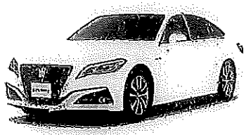
※ボディカラーなど、実車と異なる場合があります。