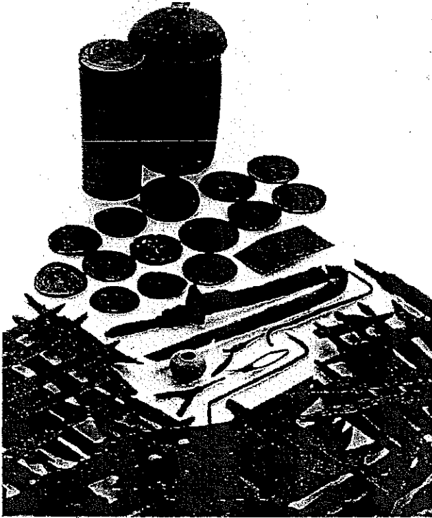
堂ヶ谷廃寺・堂ヶ谷経塚出土遺物