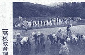
小学生との交流(田植え)

「新しい農業にチャレンジしたい」そんな夢を持つ1・2年生を対象に農業高校生・夢・未来塾という研修会を実施して昨年は、県内の農業関係高等学校校長会