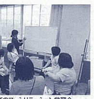
講師を招いてのファミリーセッション学習会

基本とし、さらに共に学び合う体制づくりとして、ファミリーセッション力の育成を図ることにしました。