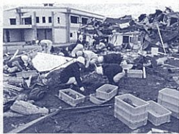
被災文化財の救出

北端の町、洋野町種市地区。南部もぐり、発祥の地であり、「南部タイバ」の故郷です。私は、ここで縄文時代の遺跡を発掘調査しています。