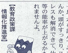
「教育政策課 情報化推進室」

改善授業について、事後研究会の充実が何より大切です。本校では、これまで付箋を活用は、これまでも付箋を活用したグループワークを進めてきました。付箋を活用することで、教員一人一人の発言する機会が増え、様々な意見を出し合えるようになりました。しかし、時間が足りな