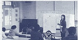
スクーリングで学びを深めます

静岡中央高校東部キャンパス 055(928)5757、中央キャンパス 054(209)2431 西部キャンパス 053(595)1300 【高校教育課】