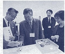
生徒の作った製品に感心

12月11日(木)、今年度8回目となる移動教育委員会。県教育委員が富士特別支援学校富士宮分校を訪問しました。