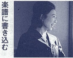
一人歌いの練習で曲と向き合う

歌い終わると、生徒が感想を述べます。男女のバランス、主旋律の表現方法、声部のブレンドなど、根拠を持って自分の言葉で伝えることを促しています。そうすることで、真剣に仲間の歌声を聴く習慣が身に付きます。しかし生徒の聴き方に偏りがあったり、具体的な言葉ではなかったりする時もあります。その時には歌詞の伝わり方や強弱の付け方など聴き取り