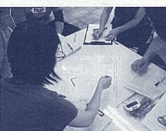
研究会以外の場でもファミリーセッションを活用

この研修の積み重ねから一人一人が視点に沿った意見を積極的に出し、学び合い改善授業の方向性を探ることができました。また、学び合ったことが、授業改善のポイントが分