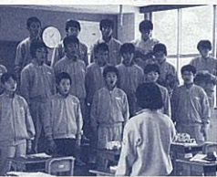
授業は歌から始める

生徒に曲を紹介する際、ただCDを流すのではなく、私が実際にピアノで演奏したり、歌ったりして紹介することを大切にしています。黙ってピアノに向かい、曲中の素敵なハーモニーや、心に迫る歌詞の部分などを丁寧に演奏します。すると新しい発見をした生徒は自