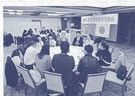
青年意見交換会で語り合う日中両青年