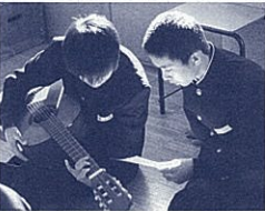
器楽でも響きのある音を

いい響きを覚え、自分の声を聴くことのできる生徒は、音楽表現に目を向けます。楽譜上の楽語や指示記号のあるところから、自分の言葉で具体的なイメージを書き込み始めます。P(ピアノ)の