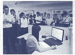
現地企業研修(中国移動通信)

日中両青年による意見交換会等を行い、考えや習慣の違いを体感しました。浙江省の青年は、今回の参加者が勤務する静岡市立竜南小学校を訪問し、日本の教育システムに興味を示していました。