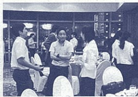
上海在住の日本人との情報交換会

本事業では、浙江省の青年だけではなく、通訳や講師を担当した中国人留学生やこれまでの参加者等とも交流の輪が広がっています。今後もこの交流を続けていきたいと考えています。皆さんもぜひ本交流に参加して日中交流の輪に加わりませんか。