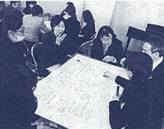
付箋を使っている話し合い

本校はR(実態把握課題把握)、P(計画)、D(授業実践)、C(評価)、A(改善)のサイクルに基づき、