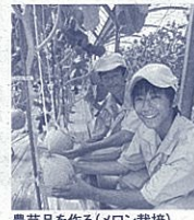
農芸品を作る(メロン栽培)