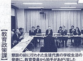
懇談の前に行われた生徒代表の学校生活の発表に、教育委員から拍手があがりました