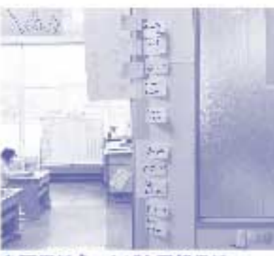
色画用紙をつなげた記録用紙付箋を使って記録を残しました

昨年度まで勤務していた静岡市立大河内小学校は、安倍川の上流に位置する小さな学校です。私は1・2年各1名ずつの複式学級の担任をしていました。国語・算数以外