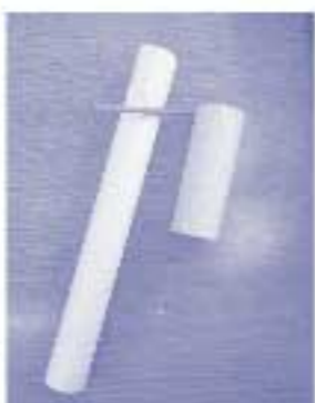
とびだしくんロケット

きるように、色画用紙をつなげた記録用紙を作り、より遠くまで飛ばすことを目指して改良を続けました。