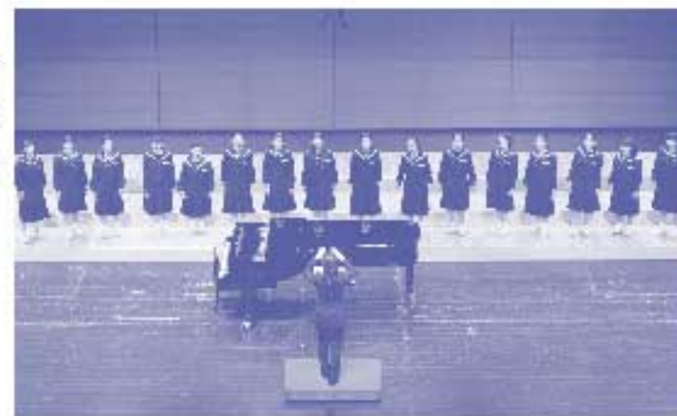
(合唱コンクール静岡県芸術祭賞) 磐田市立城山中学校合唱部

申・問 県文化政策課 ☎054(221)2254 ふじのくに芸術祭 2017 で検索