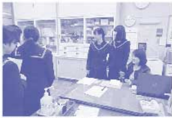
保健委員と話し合う筆者(右)