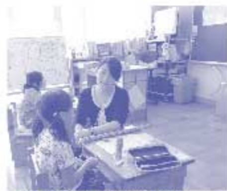
児童と授業の振り返りをする筆者