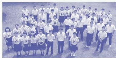
▲全校生徒で入学生を歓迎します!!

少人数なので、一人一人が主役となり、さまざまな場面で輝いています。 あなたの個性を伸ばすのにピッタリな環境です。