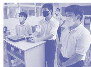
▲活躍が期待されるeスポーツ部員たち

eスポーツ以外にも、運動やボランティア活動等を実施し、心身のバランスを考慮した幅広い活動を行う予定!