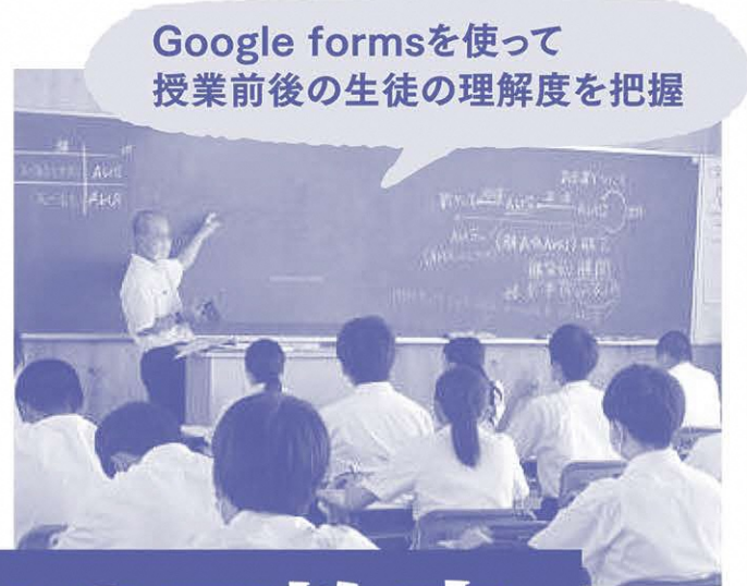
Google formsを使って 授業前後の生徒の理解度を把握