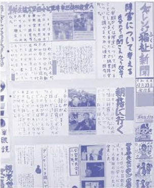
新聞制作学習(小学部)

いても楽しむことができ「た」という感想が聞かれました。読み聞かせを連綿と続けられる秘訣は、このようなところにあるのかもしれない。