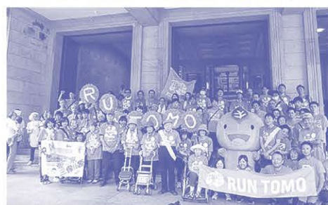
RUN伴メンバー県庁前にて(令和元年度)

静岡県と公益社団法人認知症の人と家族の会静岡県支部では、県民の認知症への理解を深め、認知症の本人や家族への施策が充実されることを目的に、例年、街頭キャンペーンを実施しています。