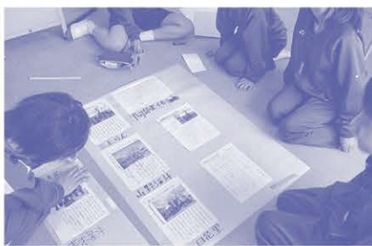
新聞制作学習(中学部)

ペンが口ほどにものを言い!? NIEの実践は、新聞を読むだけに留まりません。読んだことを発表し、聞き手と対話の中で記事の内容を擦り合わせて確認します。記事を通して、どう思ったのか、どんな感情を抱いたのかについて、お互いに伝え合うといった学習は、語彙を拡充したり、気持ち育てたりする機会になります。聴覚障害のある子どもの中には「書くのは苦手」と口にする子どもが少なくありません。新聞記事やニュースを伝え合う中で、情報を正しく送受信し、それらを文章にした読み手に分かるように書いていくことを「書く力」を養います。