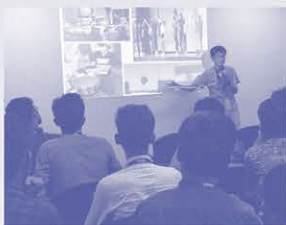
▲インド・サマーキャンプにて英語でプログラミングを学ぶ生徒たち

サマーキャンプがきっかけでそのままIT企業に就職した卒業生も!もちろん日々の業務は英語です。