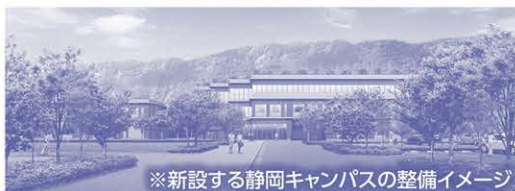
※新設する静岡キャンパスの整備イメージ