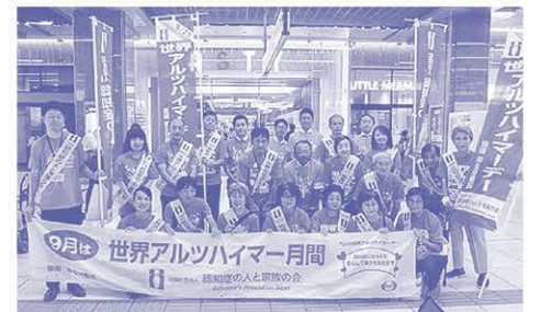
街頭活動の様子(令和元年度実施)

今年度は、両イベント共に、新型コロナウイルス感染症対策のため中止となりましたが、認知症になっても安心して暮らせる社会を目指し、さまざまな取り組みを実施していきます。