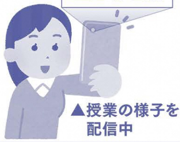
▲授業の様子を 配信中