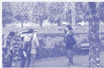
▲近隣の企業と協力し川根ツアーを企画して地域振興にも貢献

川根本町が運営する寮で約70人が自立した生活を送っています。公営の塾も! 海外研修、寮・下宿、公営塾などはすべて川根本町の協力により生徒の自己負担はほんの一部! 町による給付型奨学金もあり、充実した学校生活を送ることができます。