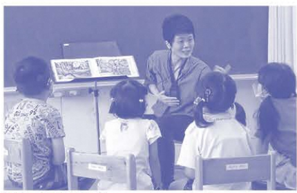
筆者の読み聞かせ

本校では、教員以外にもろう者や保護者、ボランティア団体による読み聞かせを毎年行っています。主に幼児児童が参加していますが、中学部の総合的な学習の一環として、生徒が幼児児童に読み聞かせする活動も含まれています。