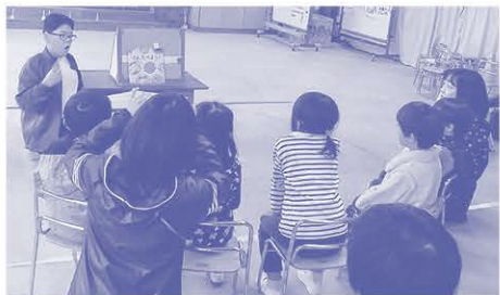
幼稚部への読み聞かせの様子

この読み聞かせは、生徒自身が絵本の内容を考え、趣向を凝らし、下級生を絵本の世界に導いていくように準備時間の確保に努めています。生徒からは「クイズを出したり、実際に絵本を動かしたりして、すごく笑いがあつても面白いと感じた」といろいろな種類の本があつたので、誰が聞