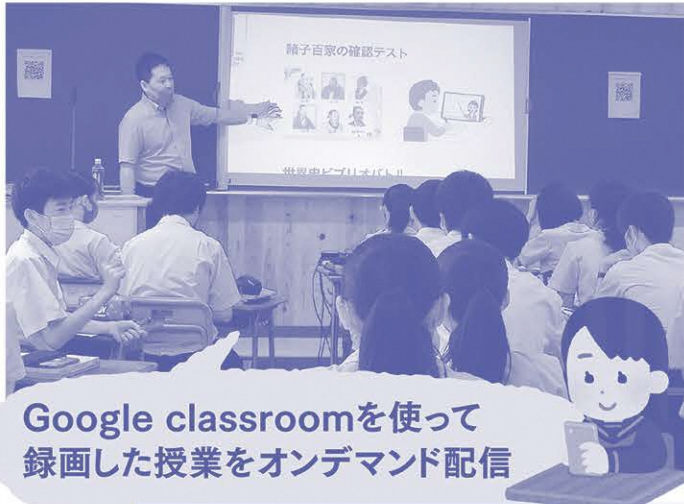
Google classroomを使って 録画した授業をオンデマンド配信