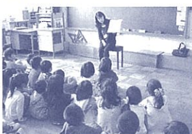
命の大切さに関わる本の読み聞かせ