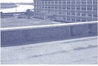
学校のすぐ脇には馬込川