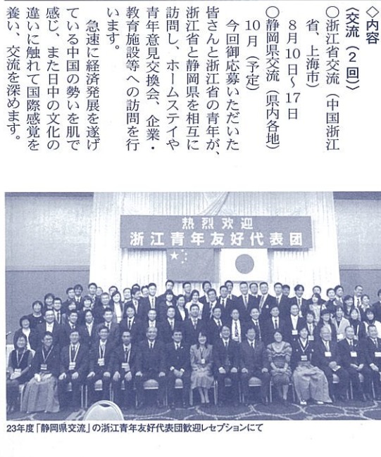
23年度「静岡県交流」の浙江青年友好代表团歓迎セレブレーションにて

親の愛を肌で感じる「こと」も、「目と目で通し合う」ことも…、すべて「見る」「見られる」意識と感覚が作用するものなのでしよう。私たちが、常にこの意識を持ち、たとえ小遣いが痩せ細っていく中にある程度、ある程度、整えなければならぬことを律することにつながるのではないのでしょうか。 私は、この背景には「見られている意識の欠如」があると思っています。「密室」から見つかりつこない「ネット、携帯だから大丈夫」「相手が言うはずがない」などの誤った意識があるのではないのでしょうか。ネット社会の秘密性など司法の前で 祥事が続発しています。この3月に公表されたデータでは、過去10年間に133人が懲戒処分を受けており、これは、10年間で見れば、ほとんどの所属で1件の処分事案が発生した計算になります。 企業防衛、被害、権利意識の高まりと通報や相談の制度。そう、壁には耳、障子には目があり、人の口の前に戸は無く、そして…悪事は千里を走るのです。20分の1の確率と踏んでキセルをすれば、20回目には発覚するのです。発覚・露見すれば処分・公表が待っています。一時の快感や些細な経済的利得の代償として失うもの大きさを良く考えてみる必要がありますね。あなたは、「見 プロフェッショナル 我々は税金で生活の糧を頂いている公務員です。一円無駄な支出も不効率的な振舞いもできない「公務のプロフェッショナル」なのです。それぞれの現場でも、多少のやりとりにくさは伴うとしても「見られている意識」を高める具体的な仕組みが必要であり、同時に、そうした意識を、社会の中で生きてゆく子どもたちに伝授する責務もあるのではないのでしょうか。