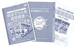
左から通学合宿実施の手引き、安全管理マニュアル、実践事例集

家庭から離れ、小学生たちが共同生活しながら、学校に通う「通学合宿」。昨年度は県内155か所で実施されました。未広がり8年目、さらなる飛躍を目指して、通学合宿が変わります。