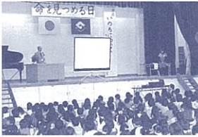
「命を見つめる日」はじめの式