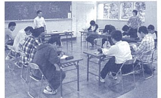
ソーシャルスキルトレーニングの講義

本年度もこの講座を開催します。 募集期間 ~5/10(木) 開講日 5/26~10/6の隔週土曜日(全10回) 場所 旧県立周智高校(森町森92-1) 受講料 無料。ただし材料費等実費負担あり。