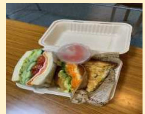
マナ・とこさんど弁当