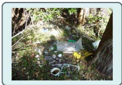
不法投棄防止統一パトロール (6月、12月)