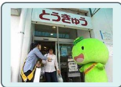
不法投棄撲滅街頭キャンペーン (6月)