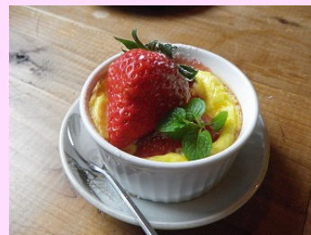
クラフティって食べたことありますか？

クラフティは、温かいプリンのようなスイーツ。甘さ控えめですが、これは紅ほっぺの甘さを引き立てるため。いちごの温められた部分がジャムのようになり、甘さがより際立ちます。今のような寒い季節、食事の最後が温かいデザートというのはうれしいですね。