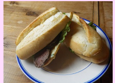
こだわりぎっしりローストサンド

ローストサンドは、ハーブに漬け込んだ伊豆シカ肉がじっくりローストされていて、簡単にかみ切れるほど柔らかく、伊豆産のわさびマヨネーズやパン（これもおいしい！）によく合います。