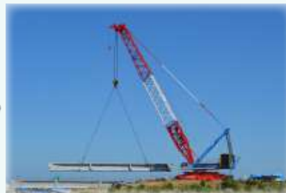
橋脚・橋台にのせる

橋台・橋脚の製作工事を進めてきましたが、ついに橋げたを架ける作業に入ります。 令和4年度の開通に向けてラストスパートです！