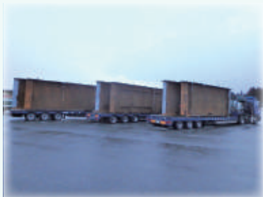
橋げたを持ってくる (和歌山の工場 → 大平)