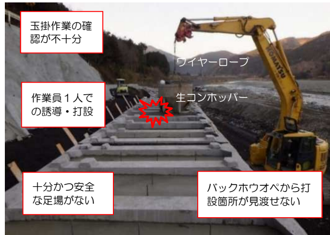
安全対策前の現場状況