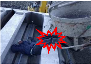
作業員被災状況（推測）

大型ブロック積胴込コンクリート打設中、生コンホッパーが大型ブロック積に接触したことでワイヤーロープがゆるみ、フックから外れた生コンホッパーが作業員の両足に接触した。