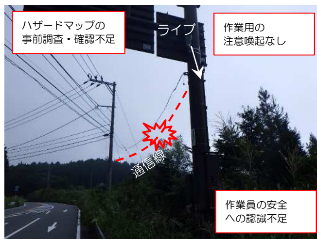
安全対策前の現場状況