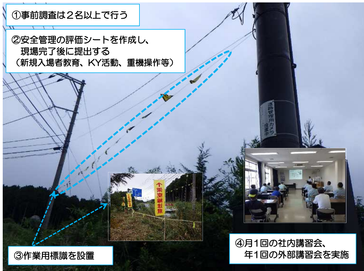
安全対策後の現場状況