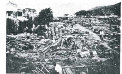
図14-7 秋葉美の津波被災状況