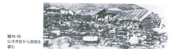
図14-15 仏光寺前から西側を望む