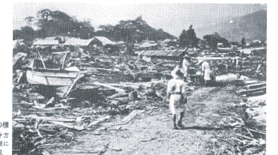
図14-8 現静海町の様子 仏光寺方向を見た津波による被害状況