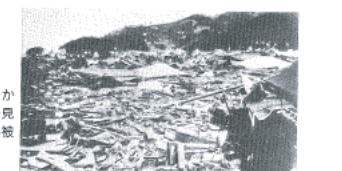
図14-16 現和田1丁目から新井方向を見た津波による被災状況