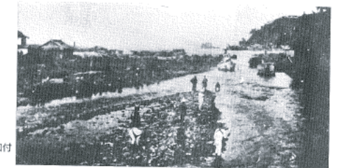
図14-13 伊東大川河口付近の様子