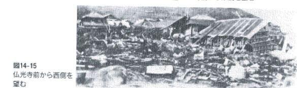
図14-15 仏光寺前から西側を望む