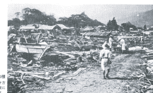
図14-8 現静海町の様子 仏光寺方向を見た津波による被害状況