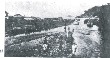
図14-13 伊東大川河口付近の様子