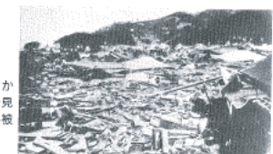
図14-16 現和田1丁目から新井方向を見た津波による被災状況