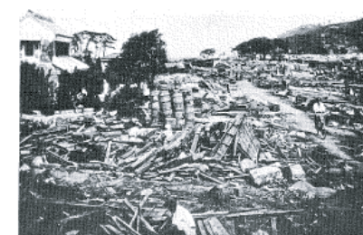
図14-7 玖須美の津波被災状況