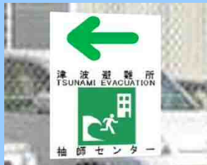
フェンス貼り付け型