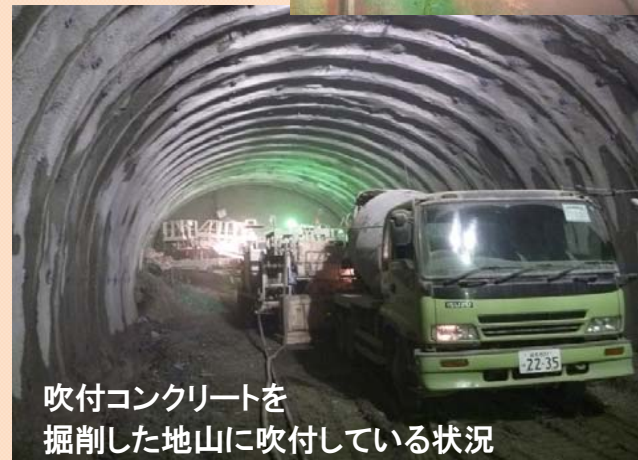
吹付コンクリートを 掘削した地山に吹付している状況