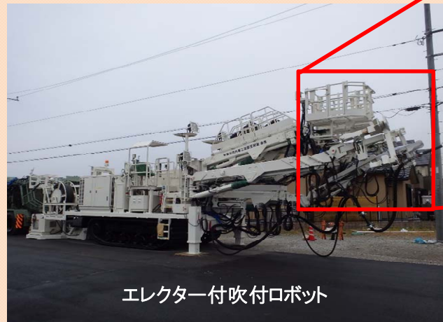
エレクター付吹付ロボット

静浦トンネルは、NATMという工法でトンネルを造っています。NATMでは、トンネルが崩れないように掘削直後の地山を吹付けコンクリートで固めます。この時、コンクリートを早く固める急結剤という粉を添加しながら吹付けします。この吹付け作業をする機械を 吹付ロボット と呼んでいます。このトンネルでは、 エレクター という鋼製支保工(アーチ型の鋼材)を組み立てる腕が付いた、【 エレクター付き吹付ロボット 】を採用しています。