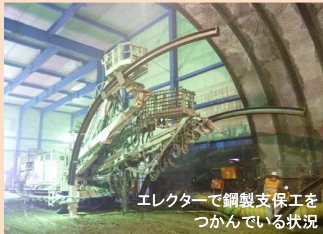
エレクターで鋼製支保工を つかんでいる状況