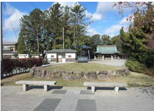
⑧ 西之島学校石碑 (若宮八幡宮)