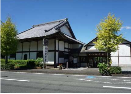
⑰長八記念館(浄感寺)