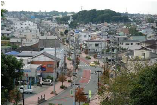
⑦ 見付宿のまちなみ (旧東海道と見付宿)