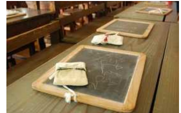
再現された教室の様子（旧見付学校）