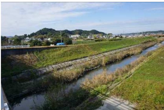
⑬内田地区の田畑風景 (上小笠川と内田地区、正面に内田小学校)