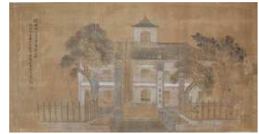
西之島学校絵図 (市指定文化財)