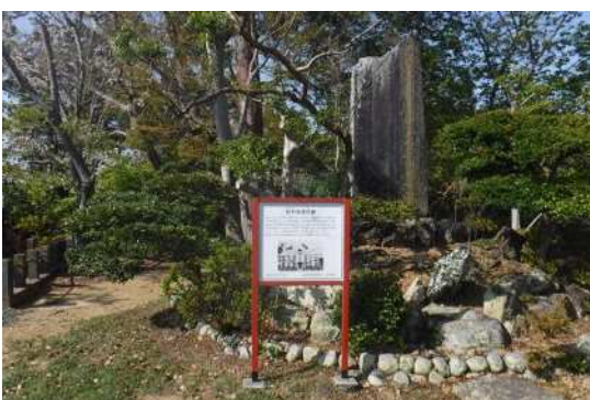
⑨ 坊中学校跡石碑 (医王寺)