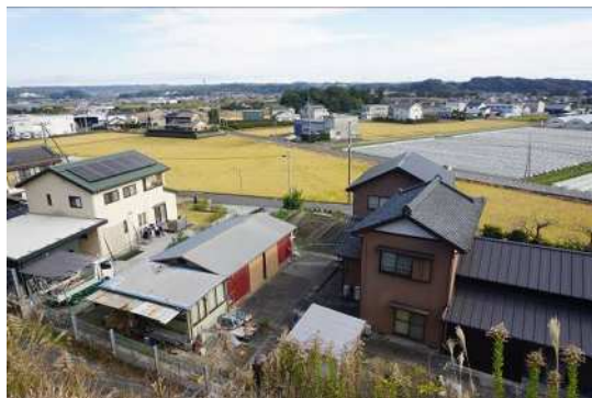
⑬内田地区の田畑風景 ため池から田園地帯を望む