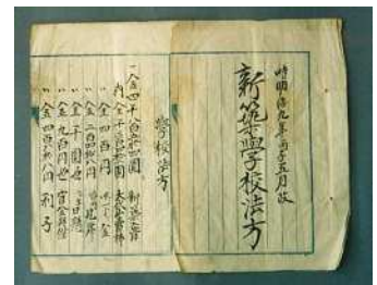
新築学校法方（予算書） （旧見付学校）