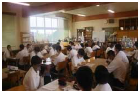
< 高等学校におけるいじめ予防に 関連する授業 >

学校が抱える諸問題について、弁護士が法的側面から助言などを行うもので いじめ予防に関連する授業 生徒指導担当教員への指導・助言 学校からの法律相談（対面又は電話）の3つの実施形態からなる。2019年度に県立高等学校を対象に開始したが、2020年度からは、公立小・中学校及び県立特別支援学校にも拡大した。学校からは、「生徒指導において学校の対応が概ね正しかったことで、安心感を得ることができた。」「今後の指導の方向性を明確にできた。」など本事業の効果を実感する声が多く聞かれている。