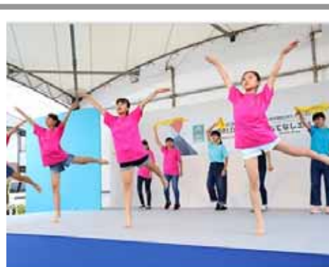
< 文化系・地域部活による公演 >

静岡県文化プログラムは「全国的プログラム」「県域プログラム」「地域密着プログラム」の3つのカテゴリーで展開している。認知度向上のため、文化プログラムのホームページに、県内各地で展開される認証プログラムを簡単に検索できるイベントカレンダーや、開催場所周辺の観光情報を盛り込んだモデルルートに掲載した。また、「地域密着プログラム」の採択団体のうち、中学生の部活動を学校外で行う全国初の文化系・地域部活（掛川市）がラグビーワールドカップ2019のスペシャルステージで公演するなど、様々な形で文化プログラムの周知を図った。