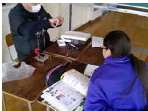
< 個別の取り出し指導 >

日本語指導が必要な児童生徒一人一人に応じたきめ細かな指導を行うため、外国人児童生徒相談員やスーパーバイザー、日本語指導コーディネーターの派遣、また、加配教員による個別の取り出し授業（特別の教育課程）を進めている。その結果、特別の教育課程を編成・実施し、一人一人に応じた支援を受けている外国人児童生徒の数が年々増加している。また、外国人児童生徒等に対して、必要な支援が実現できていると感じる学校の割合も増加している。