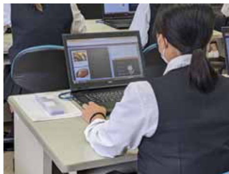
< AI教材を活用した授業 >

今後も引き続き、ICTを最大限に活用した個別最適化された学びを実現するために、機器やネットワーク環境の整備、電子教材の研究や普及、学習管理システムの導入、市町との情報共有を進めていく。