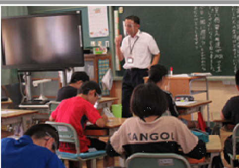
< 小学校における 「STOP! 誹謗中傷」授業 >

新型コロナウイルス感染症に関連する誹謗中傷を防ぐための取組を実施している。県のWebサイトには、「人権への配慮について」のメッセージや、教育長から児童生徒に向けたメッセージを掲載した。また、テレビ番組の県広報コーナー（7/21 SATV「いもどりナビ」）内での人権侵害に対する注意喚起の放映や、小学生・中学生・高校生それぞれに対応できるように新たに作成した教員向け人権教育指導資料（人権教育の手引きの学習例）を県内の各公立学校に配付した。各学校では、ホームルームや授業の中で、教育長メッセージや学習例を活用した児童生徒一人ひとりに向けた指導に取り組んでいる。