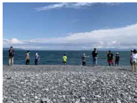
< つながりキャンプの様子 >

ネットの利用を自分でコントロールする力を養うことを目的に、インターネットやスマートフォンから離れた環境で、幅広い年代の仲間と一緒に野外活動や集団生活をしながら、認知行動療法やカウンセリングを通して、これまでの生活を振り返るキャンプを県立焼津青少年の家で開催している。今年度は小中学生を対象とし、ウォークラリーやカヌー等の自然体験活動、創作活動、医療関係者・NPOによる講座など多様なプログラムを体験しながら、自身の生活習慣を振り返る機会となった。