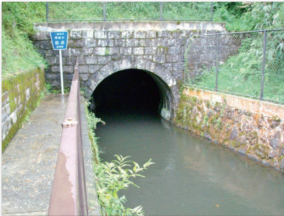
馬蹄形の流れが緩やかな箇所

■極めて精度が高く、掘削合流地点での誤差はわずか1mで、その後の日本の水路トンネル事業の模範。また、利水者は今でも湖を管理する箱根神社に感謝。