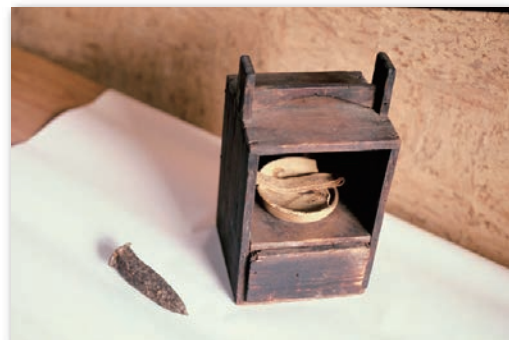
掘削工事に使用した道具 (のみ、灯台)