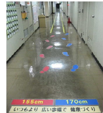
速歩き体験コーナー