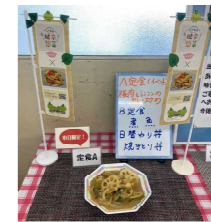
【健康惣菜の普及啓発】