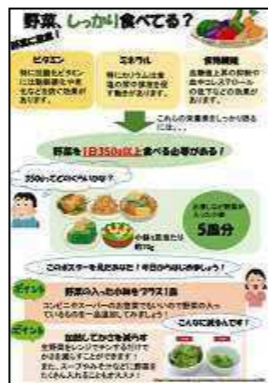
県立大学学生作成 ポスター