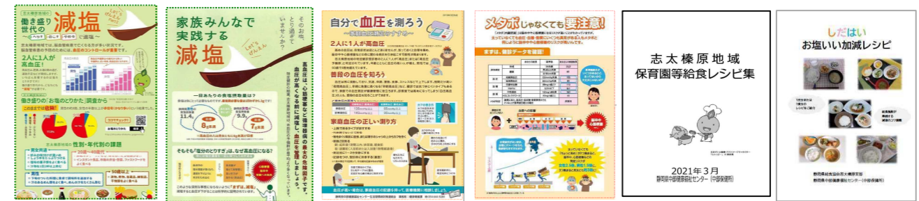
これまでに作成したリーフレット（減塩Ⅰ・Ⅱ・家庭血圧・かくれメタボ・保育園等給食レシピ集、減塩レシピ集）