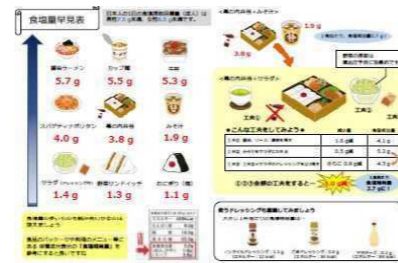
【「健康づくりは減塩から」チラシ】