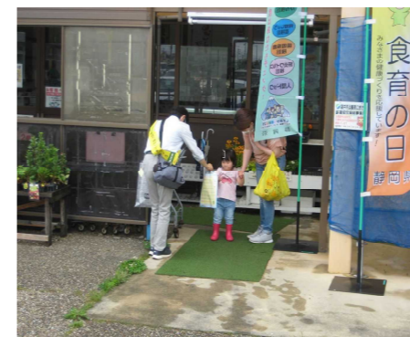
健康増進キャンペーン R4.6.22