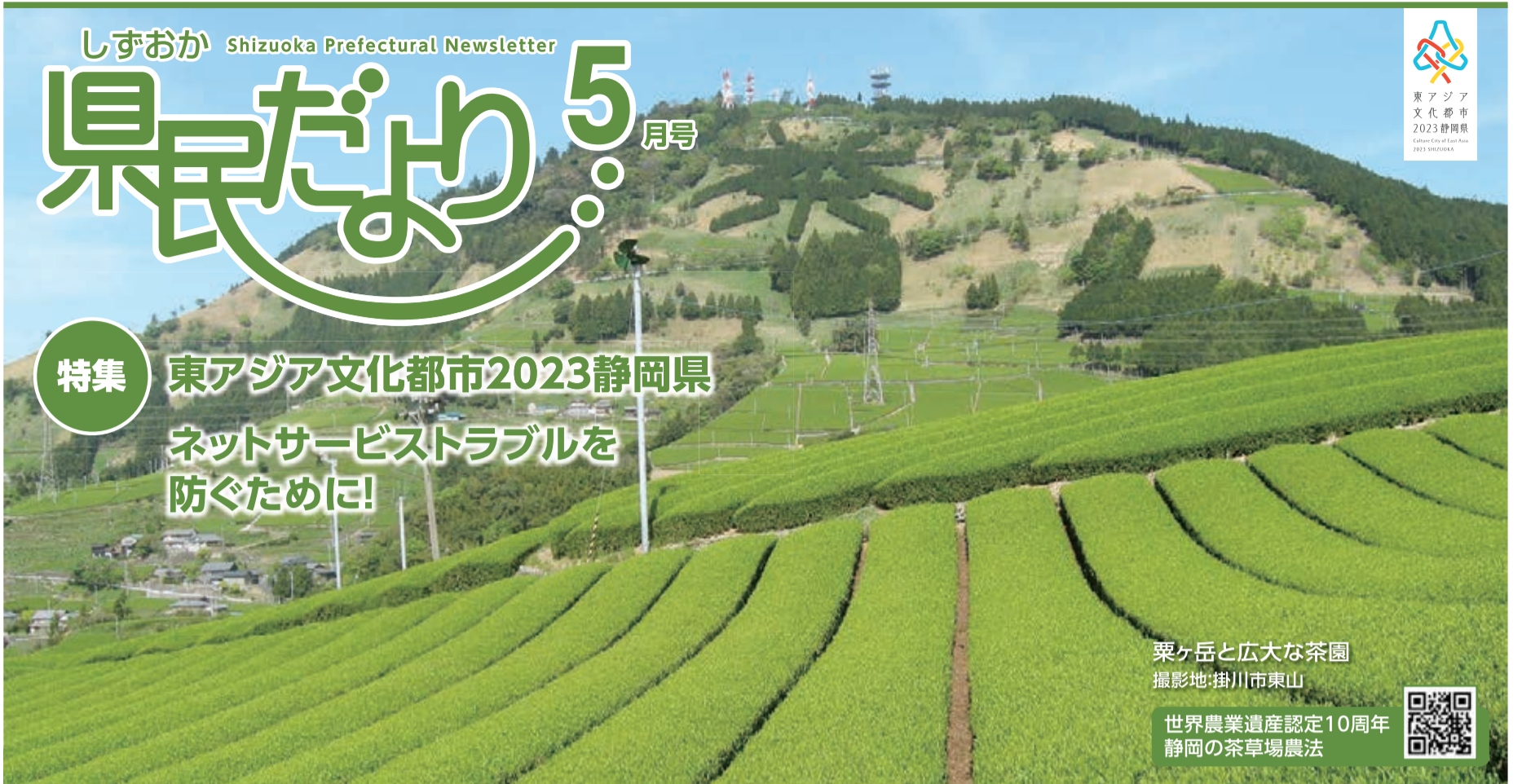
粟ヶ岳と広大な茶園 撮影地:掛川市東山