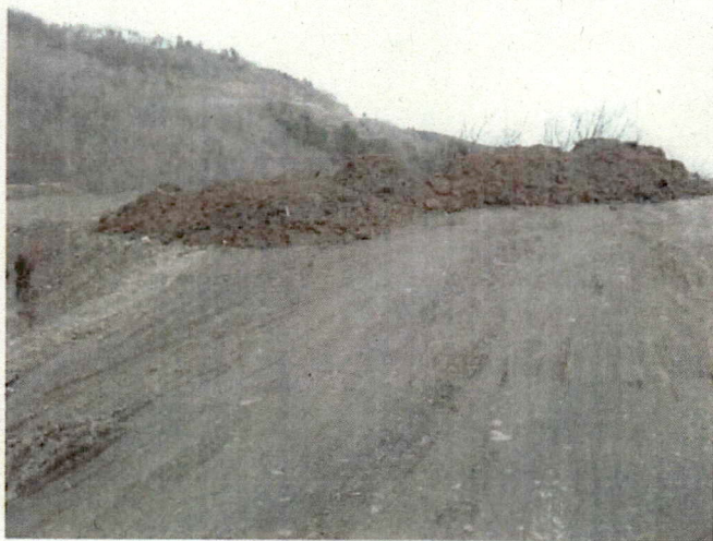
↑ 一番進入路寄りの山