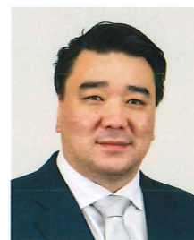
相撲 日馬富士 公平氏

関西大学教授、武道学者 (ニュージーランド出身) 剣道教士7段・なぎなた5段 居合道錬士6段・銃剣道錬士6段 短剣道錬士6段