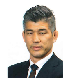
柔道 井上 康生氏

東海大学スポーツプロモーション センター教授 日本オリンピック委員会パリ五輪 対策プロジェクトリーダー シドニー五輪柔道競技金メダル