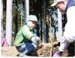
富士山麓での環境保全活動