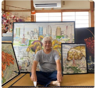
高齢者による芸術表現「超老芸術」