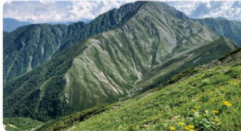
この美しさを1000年後にも。