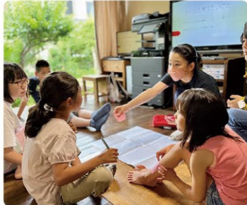
アーティストと子どもたちによる共創

アーツカウンシルしずおかは、地域資源の活用や社会課題へ対応した創造的な活動（アートプロジェクト）の支援を通して、まちづくりや観光、福祉、教育など社会の様々な分野においてイノベーションが生まれる、創造的な地域づくりに貢献します。担当課：文化政策課