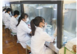
南アルプス高山植物種子保存プロジェクト

南アルプスは、ユネスコエコパークに登録され、守るべき希少な動植物が手付かずの状態に残る「世界の宝」です。県では、この「南アルプス」をより良い形で未来につないでいくため、自然環境の保全や、南アルプスが持つ魅力を国内外に広く発信するための様々な取組を進めています。担当課：自然保護課