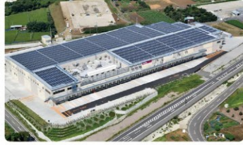
環境に配慮した産業拠点

防災・減災と地域成長の両立を目指す“ふじのくに”のフロンティアを拓く取組は、気候変動等様々な社会情勢の変化に的確に対応するため、環境・社会・経済の総合的向上の鍵である「地域循環共生圏」の形成に展開し、持続可能な地域づくりに取り組んでいます。担当課：総合政策課