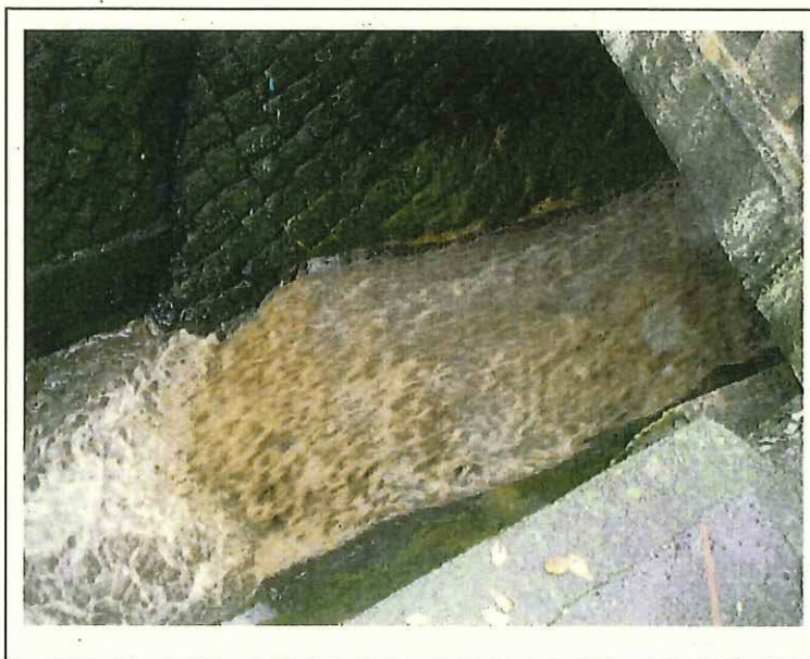
逢初川からの濁流