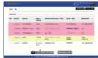
◀報告書登録済みの場合