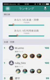
ランキング・バッジ獲得