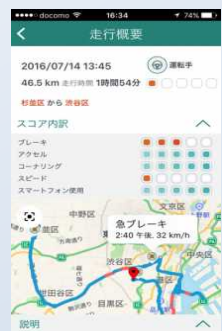
安全運転のヒント