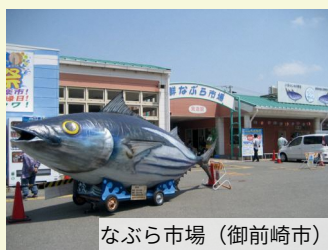
なぶら市場（御前崎市）