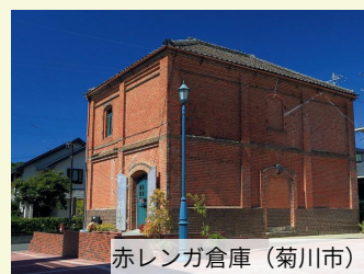
赤レンガ倉庫（菊川市）