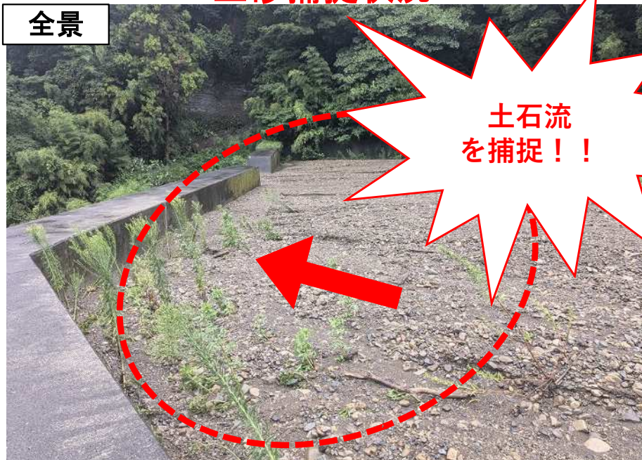
土石流防止施設 (砂防堰堤)