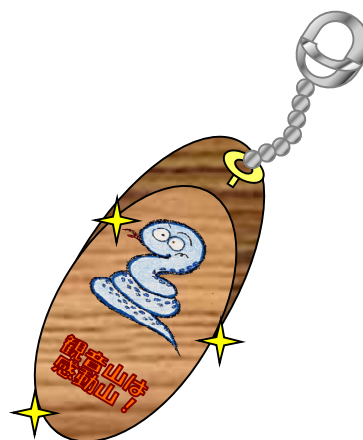
キーホルダー (120 円)