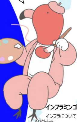
インフラミンゴ インフラについて きょうみんしん 興味津々のフラミンゴ