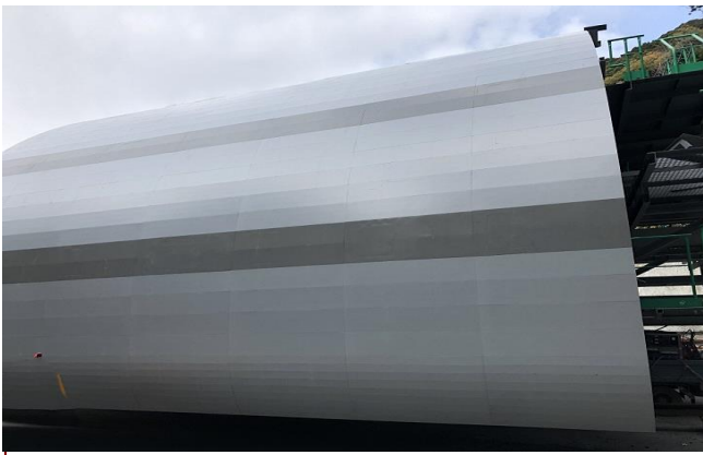
スライドセントル外観