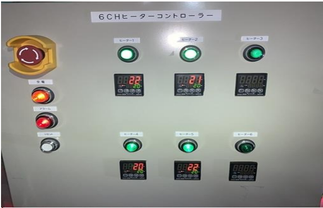
面状発熱体制御盤