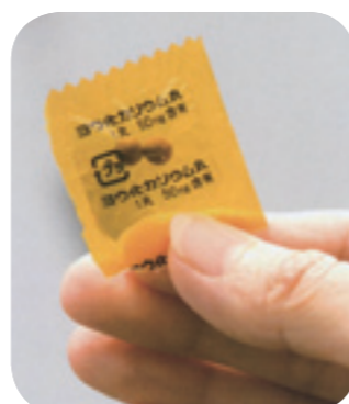
pildoras ng stable iodine

Maaaring bigyan ng pildoras ng stable iodine para sa radioactive sa evacuaton center, sundin ang utos ng doktor sa pag-inom nito. Ang pildoras ng stable iodine ay gamot para hindi maipon ang radioactive sa thyroid gland, at hindi lubusang gamot para sa radioactive.