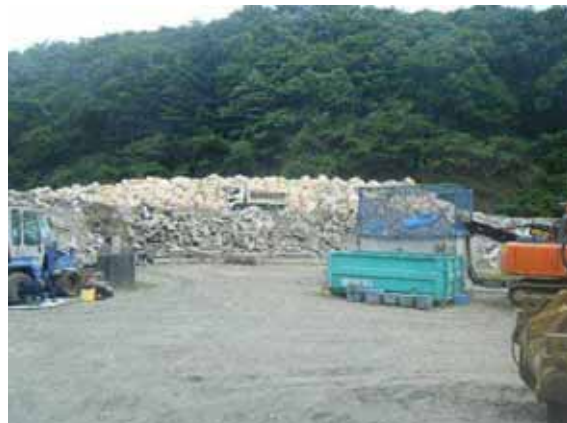
フレコンバックを用いて保管された肥料

なお、飼料、肥料の防湿を図る手段としては、このほか、保管場所の屋根の設置やブルーシート等による養生が考えられますが、この場合、水溜まりの発生防止や強風時における飛散防止のための対策を講じる必要があります。