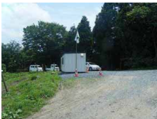
仮置場入口付近に設けられた待機所 (柱はガレキの一部を有効利用)

【取組1】宮城県松島町では、仮置場の入口付近に現場作業従事者が待機、休息するためのプレハブ小屋を設置し、水分補給を行うための設備、救急医療器具・薬品 及び手を洗う等の清潔維持のための設備を備えています。待機所には安全旗を掲揚して、作業従事者に対して安全作業遵守を喚起しています。加えて、作業現場付近に、直射日光を避けつつ、短時間の休息を取ることと併せ水分補給を行うための設備を設けています。内部には、眼への異物混入、怪我をした際の傷口洗浄のためのペットボトル、ポリタンクの水等を備えています。