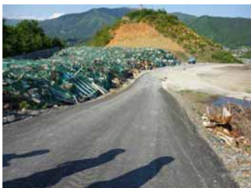
ネットで覆われた災害廃棄物 (岩手県大船渡市)

【取組】 岩手県大船渡市では、紙ごみやプラスチックごみなどの敷地外への飛散防止を図ることを目的として、仮置場にフェンスを設置するとともに、保管された災害廃棄物全体をネットで覆っています。また、岩手県田野畑村では仮置場の周囲に十分な高さのフェンス(3m)を設置し、ごみの飛散防止を図るとともに、仮置場区画の明確化、外部からの侵入防止を図っています。