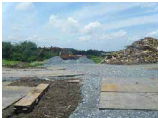
仮置場搬入路に敷設された砂利・鋼板 (宮城県松島町)

【取組】 宮城県松島町では、仮置場の搬入路に鉄板や砂利などを敷くことにより乾燥時における粉じんの飛散を防止する取組がなされています。また、宮城県七ヶ浜町では、砕いた屋根瓦を仮置場敷地内に敷設して同様の効果を得ています。