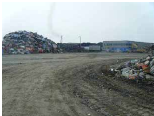
東松島市の自動車用タイヤの仮置場

【取組】 宮城県東松島市では、仮置場における自動車用タイヤの搬出をほぼ毎日行い、保管期間を最小限に留めることにより、蚊の発生防止の取組を行っています。