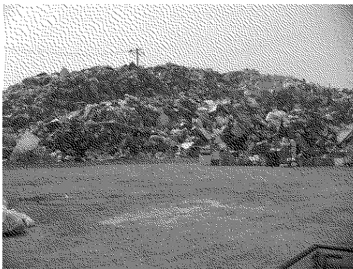
マウンドの概念図

【取組】 宮城県東松島市では、仮置場において水溜りができないように地盤全体に2%程度の勾配を設けるとともに、仮置場で混合物を保管するにあたって、まず保管場所の地盤レベルを周囲の地盤よりも高くし、積み上げられた混合ごみの水切りを図っています。