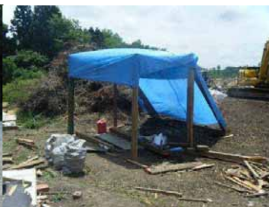
作業現場付近に設けられた休息所