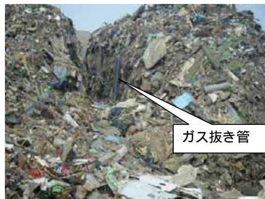
混合物の山に設置されたガス抜き管

【効果】 現場にて目視確認を行ったところ、ガス抜き管からは、湯気が噴き出しており、内部において、発熱と微生物発酵が進行していることが予測されました。このようなガス抜き管の設置によって、火災発生の抑制に効果が見込めるものと考えられます。