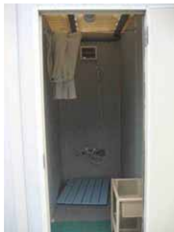
設置されたシャワールーム(写真左)とその内部(写真右)

【効果】 作業従事者に安心して働くことのできる環境を提供することなどにより、事故・災害の防止を未然に防止することが期待されます。