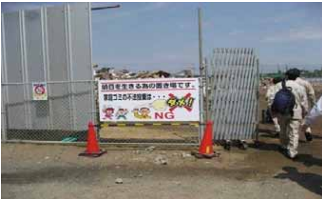
千葉県旭市仮置場ゲート入口の注意看板不法投棄禁止の注意喚起