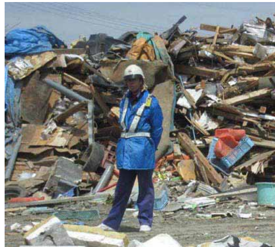
盗難防止のためのガードマン