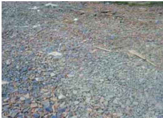
屋根瓦で覆われた仮置場敷地 (宮城県七ヶ浜町)

【効果】 仮置場の搬入路を整備することにより、粉じんの発生・飛散による作業環境及び周辺環境の悪化を防止することが期待されます。