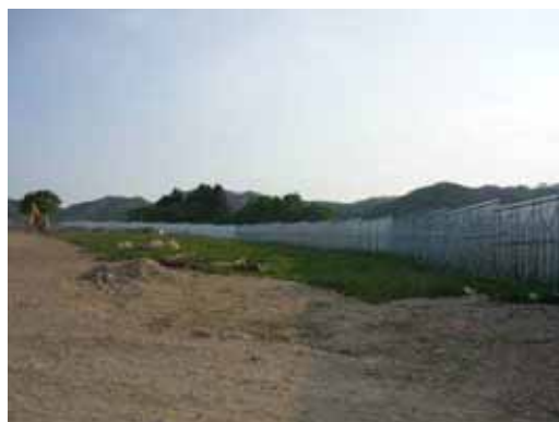
仮置場周囲に設置されたフェンス (岩手県田野畑村)

【効果】 仮置場からの紙ごみなどの飛散を防止することにより、周辺環境の悪化防止する効果が期待されます。