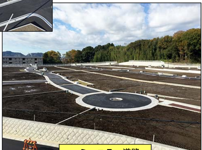
コミュニティ道路