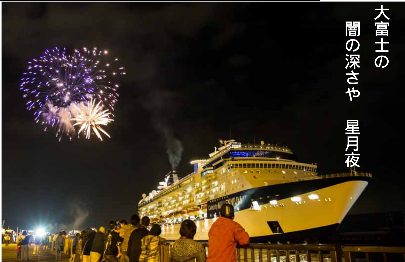
外国客船「セレブリティ・ミレニアム」清水港を出港