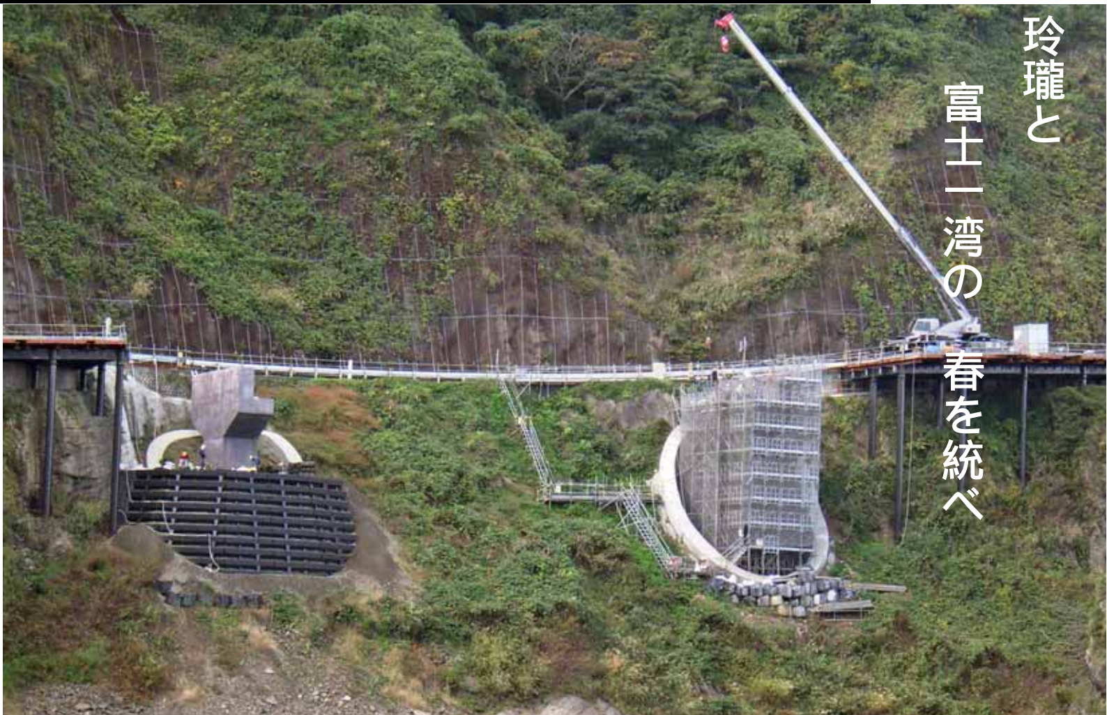
伊豆の観光を支える国道136号を整備