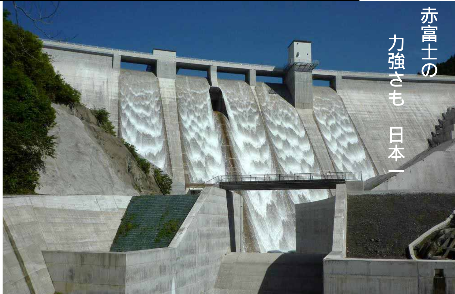
ダムの放流の様子