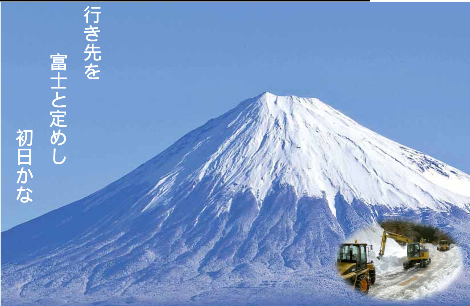
富士山麓の交通を確保～除雪作業～ (御殿場市)