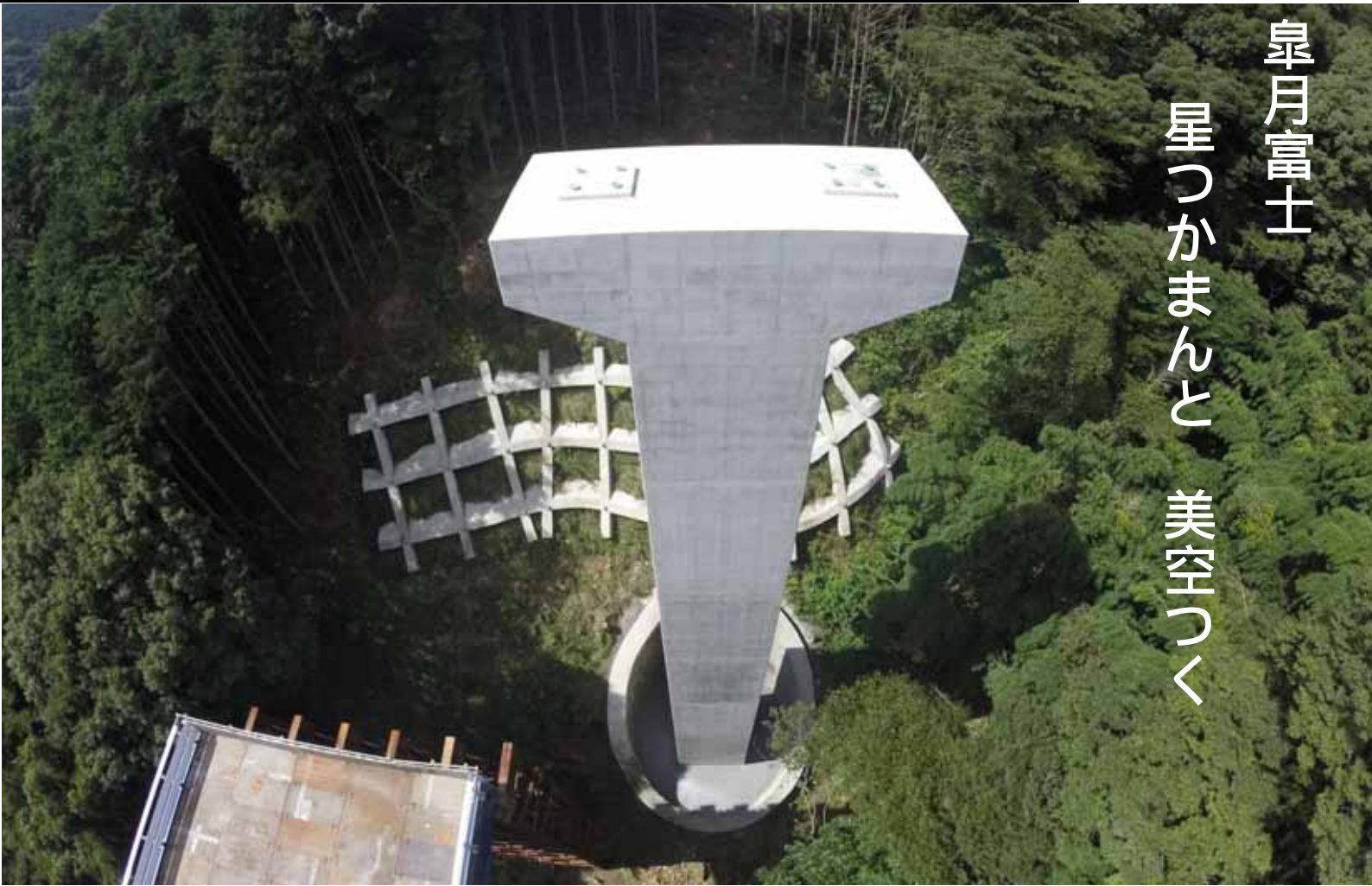
地形の急峻な土肥峠工区での橋梁工事